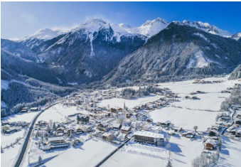
1.076 METER KRIMML

“Snow reliability” is not just a promise in Gerlos, but a guarantee. 150 km of slopes from 1,246 m to 2,505 m altitude fascinate from December until Easter. Downhill ski runs are possible into the town. In addition, free offers such as Photopoints, SpeedCheck and SkiMovie tracks make the skiing day even more exciting. Even off-piste, you will experience unforgettable moments when walking in a snowy landscape or cross-country skiing on the snow-sure trails.