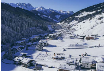
1.246 METER GERLOS

The holiday village of Königsleiten, at an altitude of 1,600 m has a lot to offer: From fun on the slopes on skis and boards through to sparkling après ski and romantic and magical evenings in alpine huts. Those who are looking for something more peaceful can find harmony and relaxation in Wald. The Zillertal Arena can be easily reached by car or free ski bus on toll-free roads. Finally this cosy town at the foot of the „skiing mountains“ is an eldorado for cross-country skiers and hikers.