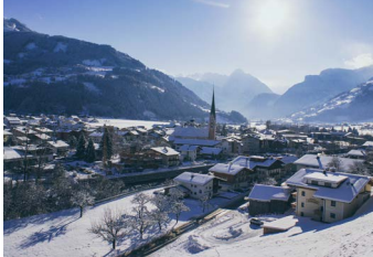
575 METER ZELL AM ZILLER

Langlaufen Ob Skating oder Klassisch – auf den zahlreichen Loipen in den Orten Zell am Ziller, Gerlos, Wald-Königsleiten und Krimml-Hochkrimml ist für jeden etwas dabei.