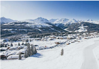
1.600 / 900 METER KÖNIGSLEITEN & WALD

Located in the heart of the Zillertal, Zell presents itself as an eventful entry into the Zillertal Arena and is the perfect holiday resort to experience the entire 548 km of slopes in the Zillertal. Zell also has a lot to offer off the slopes: The Zell leisure park and the BrauKunstHaus adventure world enrich the holiday experience. Even more action is offered by two snowtubing tracks as well as the 7 km long illuminated natural toboggan run in the area Gerlosstein.